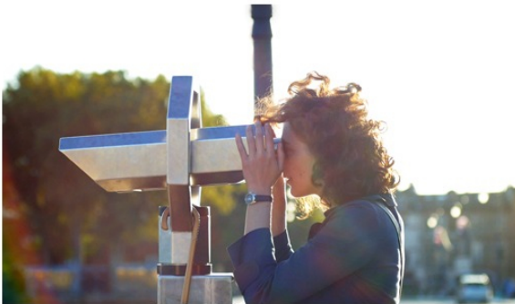
Un momento de Los exiliados románticos , de Jonás Trueba

CARLOS REVIRIEGO | 24/12/2015 | Edición impresa