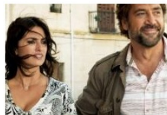
Candidatos a los Goya 2019